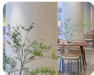
ЛЁГКАЯ АДАПТАЦИЯ К РАЗЛИЧНЫМ ФОРМАМ