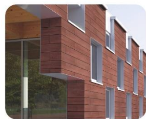
МОНТАЖ НА ЛЮБУЮ ПОВЕРХНОСТЬ ФАСАДА